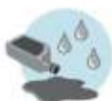
متوسط وزن چکه های کثیف، نشت های متوسط و ریخت و پاش، کارهای روزمره