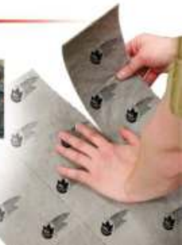
به عنوان دستمال