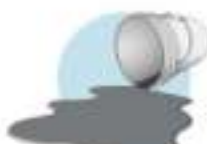
وزن سنگین چکه های کثیف نشت های بزرگ و پاکاب طاقب فرسا را بیرون می ریزد