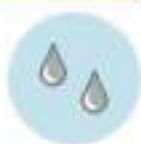
سبک وزن لایه های مهار کننده، نشتی های کوچک و ریخت و پاش، و پاکاب سریع

برای مشاهده آنلاین این جاذب های فقط روغن به www.payeshspill.ir مراجعه کنید.